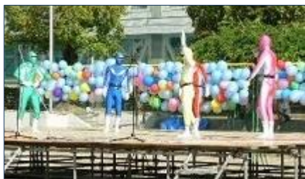
絆戦士 河南ナンジャー 登場

8:50 グラウンドにて開催式、オープニングを飾ったのは100周年を記念して作成されたマスコットキャラクター「絆戦士河南ナンジャー」の五人組によるパフォーマンスでした。その後、自治会による開祭宣言、挨拶と続き、70期生有志が作詞作曲したテーマソング“絆の在りか”を初披露してくれました。