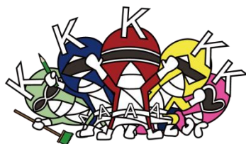
マスコットキャラクター