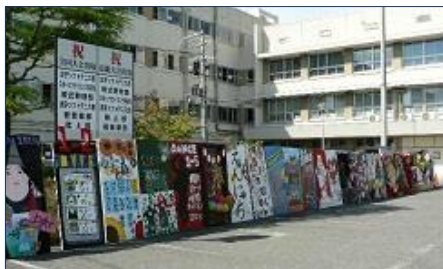
全27クラスの立て看板

続いて、各クラスが趣向をこらして作成した立て看板です。どのクラスも自分たちをアピールするために様々なアイデアを発揮していました。