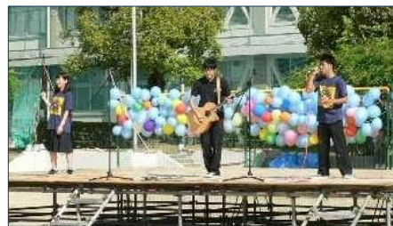
70期生有志 “絆の在りか” 披露

来場者をまずお迎えするのが正門真正面の大階段を飾りつけた自治会の力作“階段アート”です。毎年、自治会執行部のメンバーが総力をあげて作成してくれています。