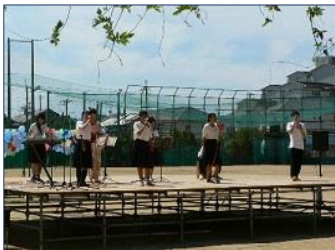
フォークソング部

他に軽音楽部、茶道部、文芸部、クッキング部、科学部、ESS部、園芸部も発表しています。